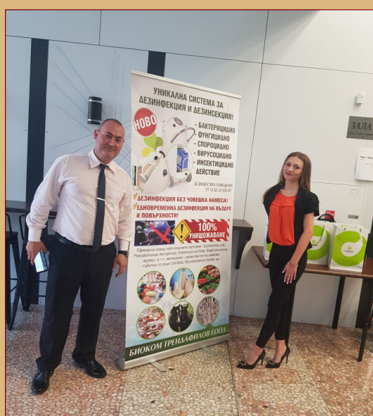
Малка част от презентациите и лекторите